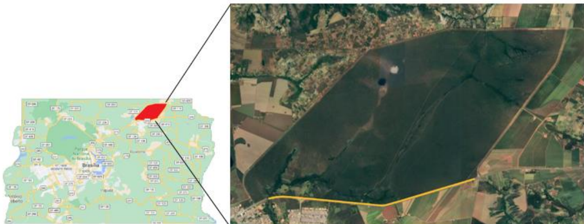
Figura 1 – Mapa do Distrito Federal, destacando em vermelho a Estação Ecológica de Águas Emendadas, localizada a 50Km do Plano Piloto. Estação Ecológica de Águas Emendadas á direita, em amarelo o trecho da rodovia BR-020 amostrado.

A rodovia federal radial BR-020 possui 2.038km de extensão e abrange de Brasília até Fortaleza. O trecho selecionado para o estudo, totaliza 10Km, paralela à fronteira sul da Estação Ecológica de Águas Emendadas – ESECAE. A ESECAE está localizada no extremo nordeste do Distrito Federal, sobre território regional administrativo de Planaltina (Fig. 1). A proteção para área foi criada em 1968 como Reserva Biológica (Decreto nº. 771) e em 1988 passou para a categoria de Estação Ecológica (Decreto nº. 11.137). Atualmente seu território conta com 10.547 hectares, o equivalente a 17,6% da área de Unidades de Conservação em Proteção Integral no DF, representando 0,5% da área sob proteção em estações ecológicas existentes no Cerrado (IBAMA, 2009). A área é repleta de alterações antrópicas, circundada por zonas rurais e urbanas. Clima tropical, com uma estiagem que se prolonga por aproximadamente cinco meses. A fisionomia predominante nas periferias da reserva é o cerrado típico, porém devido a degradação/fragmentação causada pela rodovia, a área pesquisada passou a ter predominância de gramíneas exóticas e portes arbustivos.